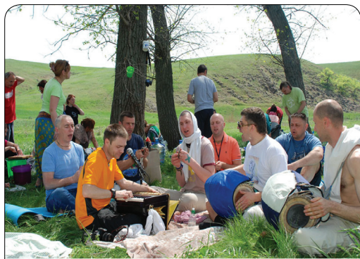
Киртан на природе

Все это время наши дорогие Божества: Джаганнатха, Баладева и Субхадра стояли на импровизированном алтаре и радостно улыбались. Через какое-то время Господь Баладева, очевидно, забыв о том, что его форма является статичной, решил лично попробовать стоящий на алтаре торт. На глазах у всех Он «спрыгнул» в блюдо с тортом. Таким образом,