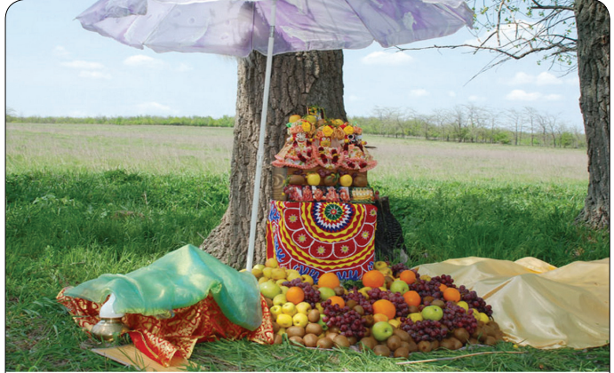
Импровизированный алтарь для Божеств

Поклонение Божествам, танцы в лучах заходящего солнца и счастливые близкие лица вокруг... Мы и не заметили, как этот сказочный день пролетел,