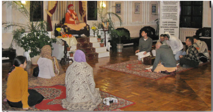
Ночная нама-санкиртана в донецком храме